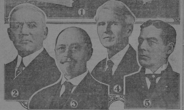
1. RACE BETTERMENT BUILDING AT EXPOSITION—2. Senator TOWNSEND, 3. Prof. IRVING FISHER, 4. Governor FERRIS, 5. Senator OWEN